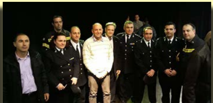
από την εκδήλωση στη Σάμο